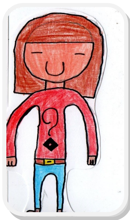
Rysował Witek Iech (klasa 5d)