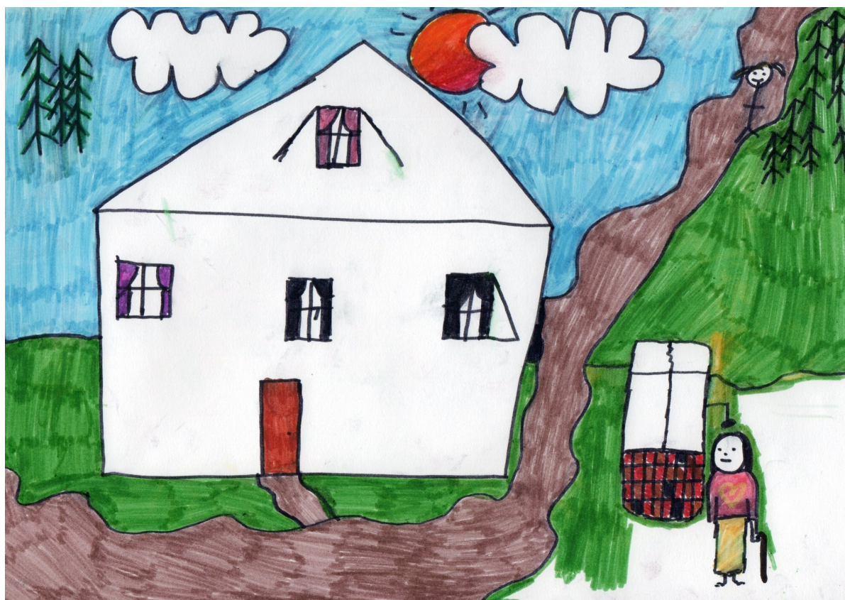
Ilustracja do bajki filozoficznej Agaty Maciągowskiej pt. Studnia