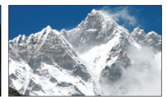
Lhoce (Nepál, Čína) – 8 516 m n. m.