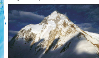
Gašerbrum I (Pakistan, Čína) – 8 068 m n. m.