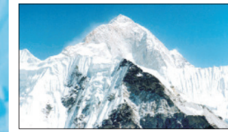
Makalu (Nepál, Čína) – 8 463 m n. m.