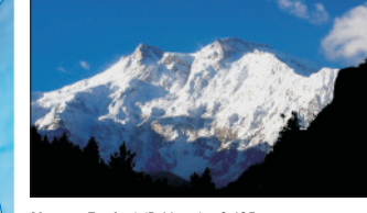
Nanga Parbat (Pakistan) – 8 125 m n. m.