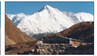
Cho Oju (Nepál, Čína) – 8 201 m n. m.