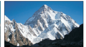
K2 (Pakistan, Čína) – 8 611 m n. m.