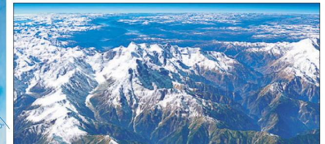
Himaláje (Čína, India, Nepál, Bhután, Pakistan) – dĺžka 2 500 km, šírka 180 až 380 km. – najvyššie pohorie na Zemi, v ktorom sa nachádza všetkých 14 najvyšších vrcholov sveta – „osemtisícovky“.