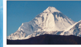
Dhaulagiri (Nepál) – 8 167 m n. m.