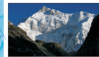
Káčaňdzunga (Nepál, India) – 8 586 m n. m.